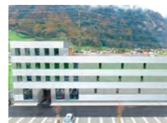
Société affiliée Altdorf, Suisse