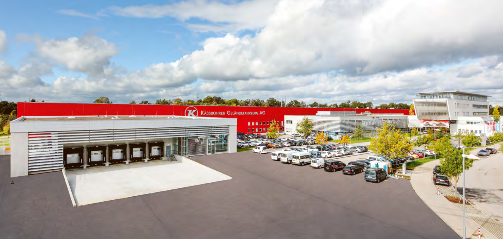
Kässbohrer Geländefahrzeug AG, Laupheim, Allemagne

Une violation du code de conduite peut avoir des conséquences graves pour l'employé, pouvant aller jusqu'au licenciement.