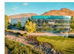
Société affiliée USA, Reno, Nevada