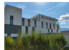
Société affiliée Italie, Bozen