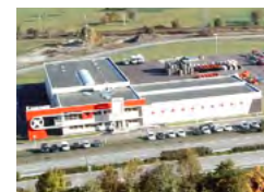
Société affiliée France, Tours en Savoie