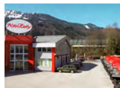
Société affiliée Kuchl, Autriche