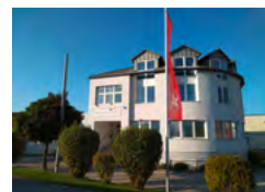
Société affiliée Micheldorf, Autriche